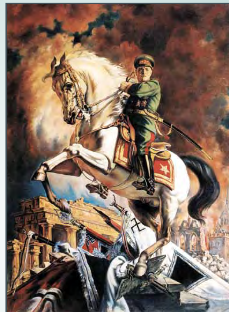
Худ. В. Яковлев. «Портрет маршала Георгия Жукова»

Архетипов может быть множество, перспектива лежит в выделении общезначимых, исторически сформировавшихся на территории России. В ко-