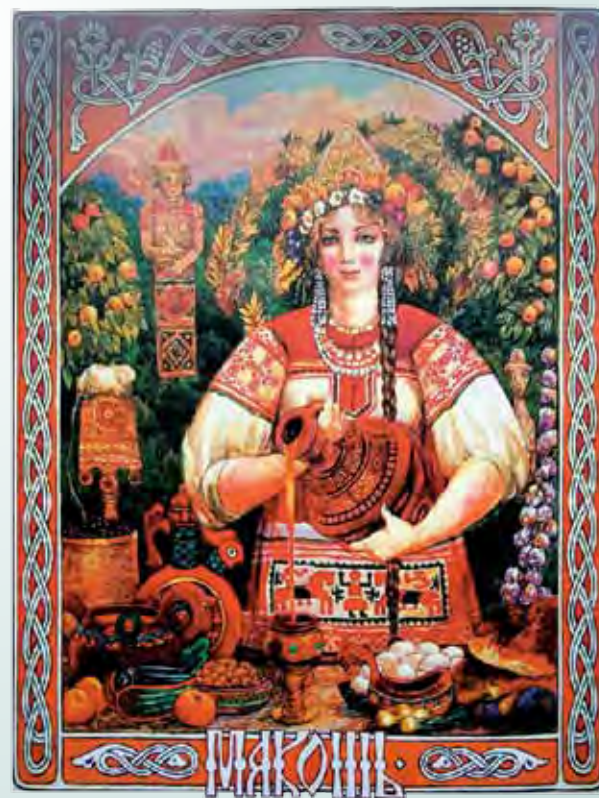
Худ. В. Корольков. «Макошь»

Действительно, у россиян под воздействием внешних обстоятельств взгляды и действия меняются на противоположные. Происходят внезапные и мгновенные переходы «от любви к ненависти», «из огня да в полымя». Это оказывает разрушительное и дестабилизирующее воздействие на отношения между людьми и делает нас восприимчивыми к манипуляциям. В результате страдает дело. Этот архетип возник во времена объединения славянских племён и русов. Принятие православия, в результате которого наступила ситуация