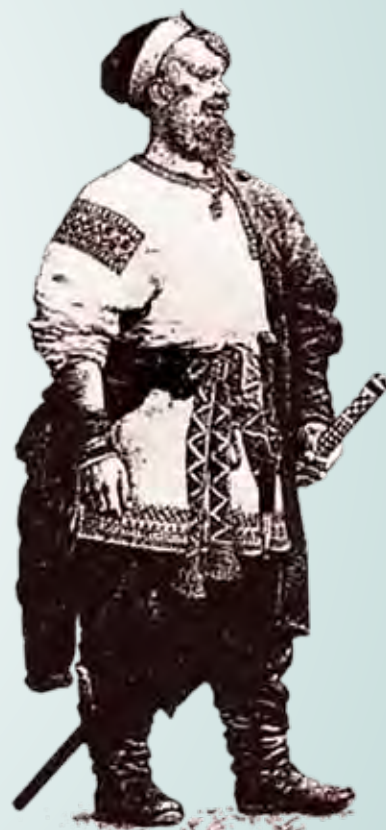
«Тверской кулачный боец». Лубок начала XX века.

Архетип «защитника» также сформировался достаточно давно и связан с тем, что территория расселения наших предков подвергалась агрессивным экспансиям; авары, хазары, печенеги, половцы, монголо-татары, крестоносцы в древности. Ли-