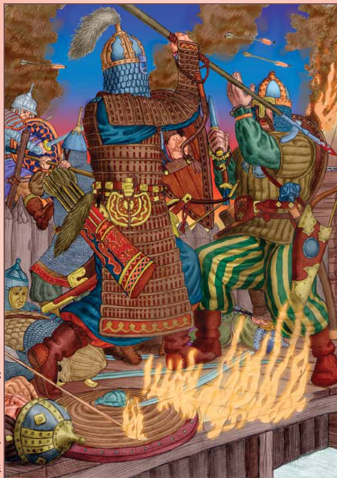
Худ. А. Гусельников. «Бой русичей с баскаками»

В 1300 году дружина Даниила Московского под Переяславлем-Рязанским разбивает сильный ордынский отряд. В 1310 под стенами Брянска отбито нападение другого отряда. В 1315 году под Торжком бьются с ордынцами новгородские дружины. В 1317 году войско князя Михаила побеждает войско Юрия и Кавгадыя, выступавших совместно. Эти бои не могли ослабить орду,