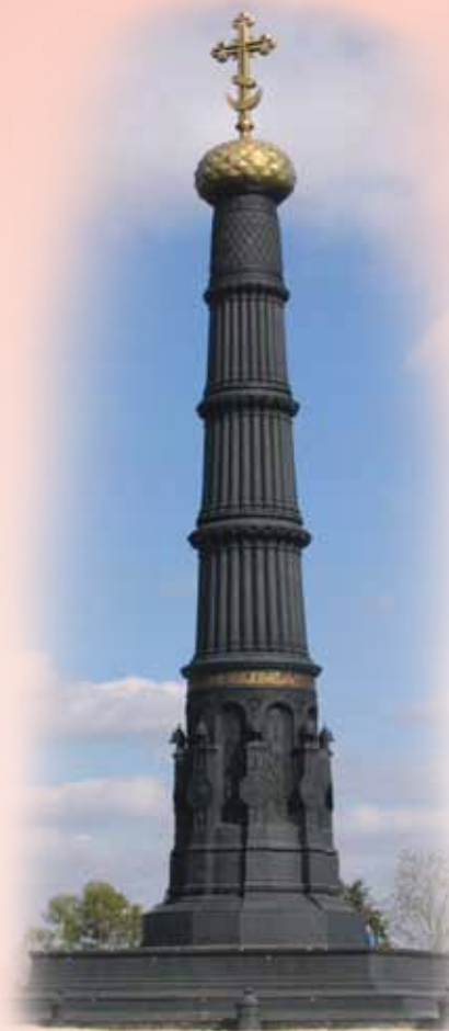
Обелиск в честь Дмитрия Донского на Куликовом поле

Русь победила. Победа была полной. В результате сражения были наголову разгромлены и уничтожены войска Золотой Орды. Была ликвидирована реальная угроза тотального погрома русской земли, последствия которого трудно вообразить. Русская рать в ходе сражения тоже понесла большие потери. Семь дней собирали и хоронили в братских могилах павших воинов.