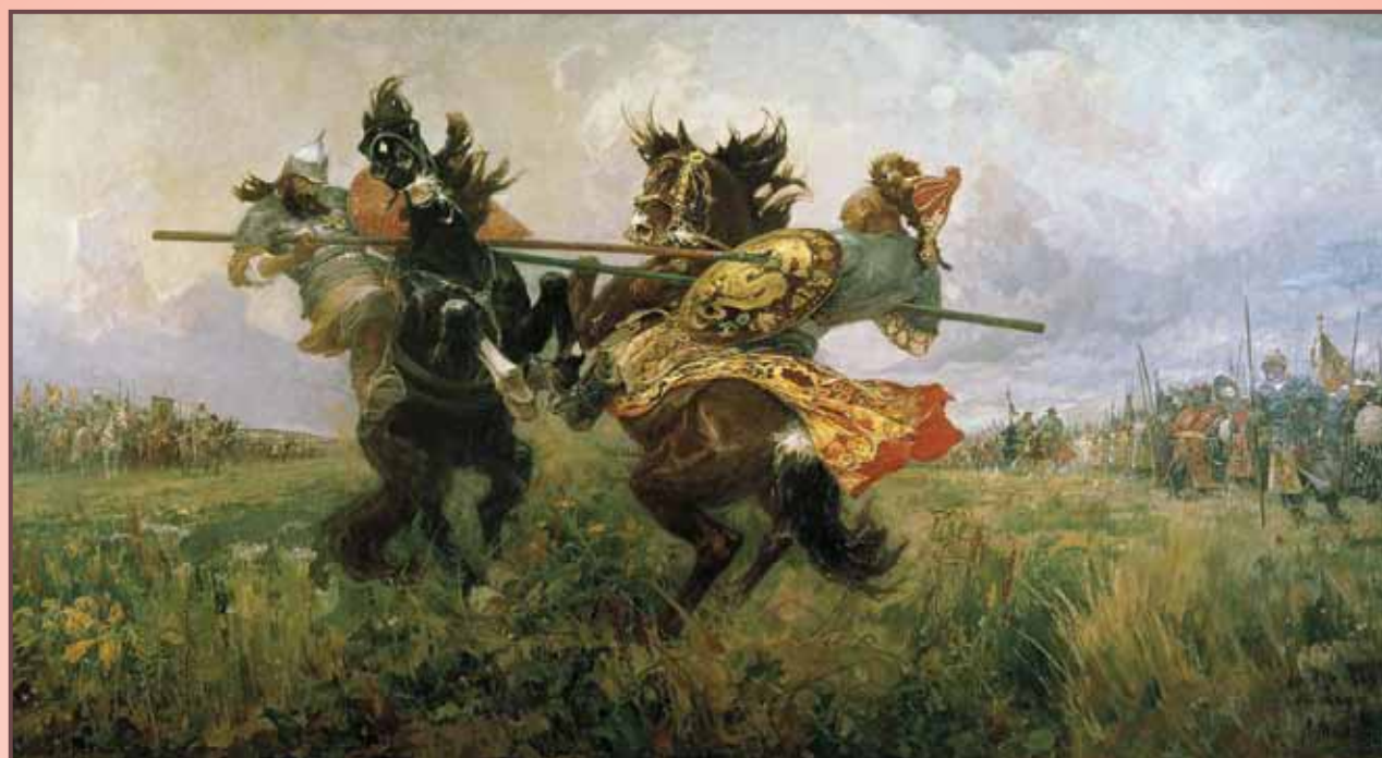
Худ. М. Авилов. «Поединок на Куликовом поле»

Коломна. Впервые в истории Руси XII-XIV вв. под стяги великого князя московского Дмитрия Ивановича собралось 100-150 тыс. воинов.