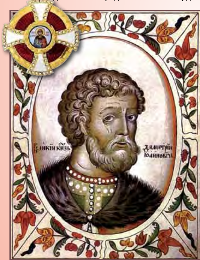
Великий князь Дмитрий Донской и орден его имени

Тем не менее, ордынцы не могли себя чувствовать в безопасности на территории русских княжеств из-за стихийно вспыхивавших против устанавливаемых ими порядков восстаний. Первые крупные антиордынские выступления начались в 1257-1259 годах. Вызваны они были как переписью населения, так и злоупотреблениями «бесерменов». Смерды совершали неожиданные нападения на представителей орды.