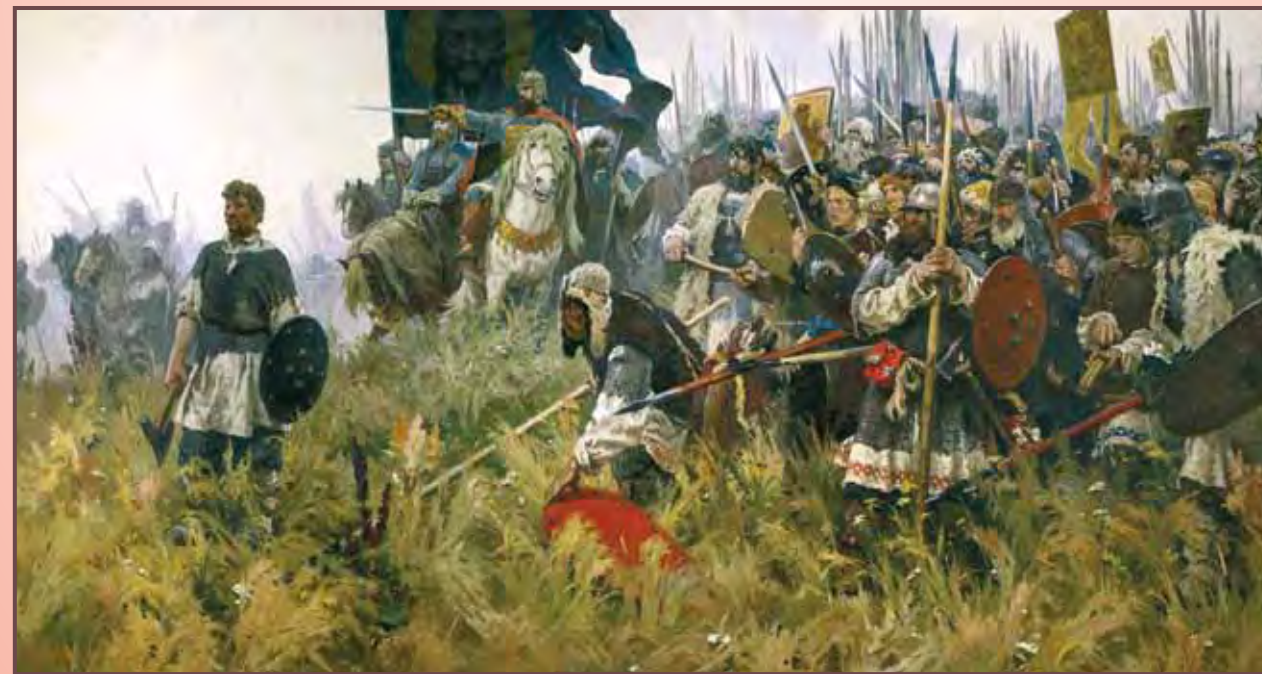
Худ. А. Бубнов. «Утро на Куликовом поле»

К осени 1380 г. основные силы Мамаю переправились через Волгу и медленно продвигались на север для встречи с союзниками в районе реки Оки. Местом концентрации русских войск была назначена