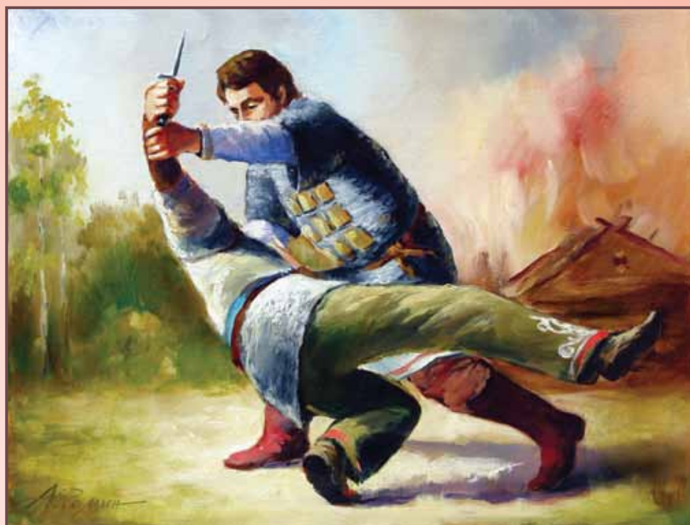
Худ. А. Фомин. «Поединок»

боя, соединяя древние традиции и насущные реалии. Новые приемы требовали изменения вооружения, которое также было сделано. Сомкнутый строй пещцев имел на вооружении копьё с узколистным наконечником 2-3 см длиной, которые легко останавливали конный строй монголов в кожаных доспехах с нашитыми медными пластинами. Короткие копьё-сулицы с кинжаловидными наконечниками, не только металась во врага, но и использовались в рукопашном бою при перемещении рядов. Рогатины использовались против лошадей противника. А в плотном столкновении в ход шли топоры, секиры, палицы. А если уж доходило до слишком тесного столкновения, когда передние ряды сталкивались телами вплотную, в ход шли кинжалы и ножи. Всеми этому приходилось учиться, совмещая старые способы подготовки и новые, полученные во время стычек с татарами.