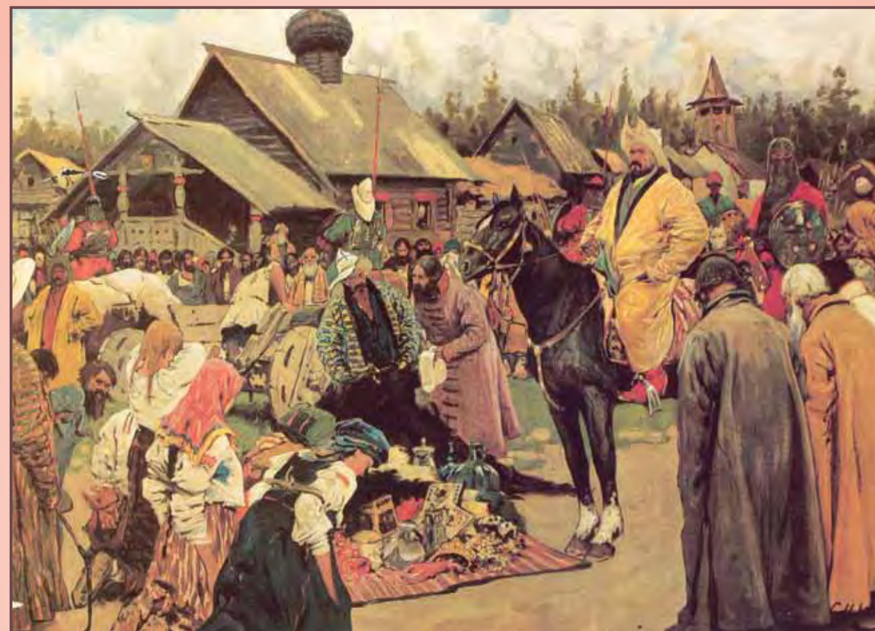
Худ. С. Иванов. «Баскаки»

перепись населения, они начали попытки распространения на Руси своей военной системы. Массовые мобилизации взрослого мужского населения, привели к тому, что была народу «нужда велика». Много русских воинов, участвовавших в походах монголов, погибло. Их часто ставили на самых опасных направлениях. Больше распространение получило устройство армии, когда командирами были монголы, причём до младшего командного звена, а рать состояла из русских воинов. Летописи сообщают о приходе на Русь лиц командного состава — десятников, тысячников и тёмников но ничего не говорят, что вместе с этими лицами командного состава, пришли бы на Русь и монгольские